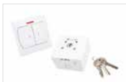
Wipp- und Schüsselschalter