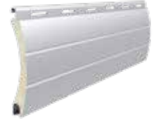
PA 43 Höhe des Profils: 43 mm Breite: 8,8 mm