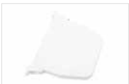
Wickler für Gurt