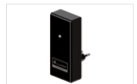
Intelligente Gebäudesteuerungszentrale ZenPro SmartPilot