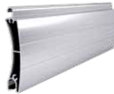
PE 55 Höhe des Profils: 55 mm Breite: 14 mm