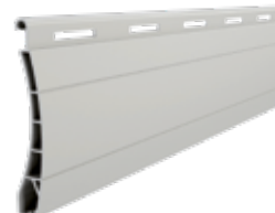
PT 37 Höhe des Profils: 37 mm Breite: 8 mm