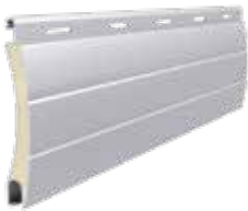
PA 45 Höhe des Profils: 45 mm Breite: 9 mm