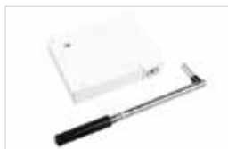
Kurbelwickler für Gurt