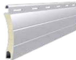
PA 55 Höhe des Profils: 55 mm Breite: 14 mm