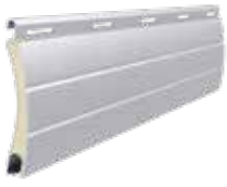
PA 37 Höhe des Profils: 37 mm Breite: 8,5 mm

Aluminiumprofile mit Polyurethan ausgeschäumt, Typen: