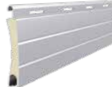
PA 40 Höhe des Profils: 40 mm Breite: 8,7 mm