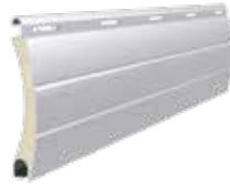
PA 39 Höhe des Profils: 39 mm Breite: 9 mm