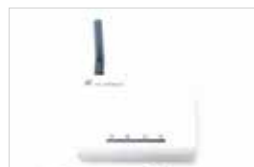
Intelligente Gebäudesteuerungszentrale ZenPro SmartControl