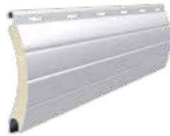
PA 52 Höhe des Profils: 52 mm Breite: 13 mm