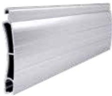
PE 41 Höhe des Profils: 41 mm Breite: 8,5 mm